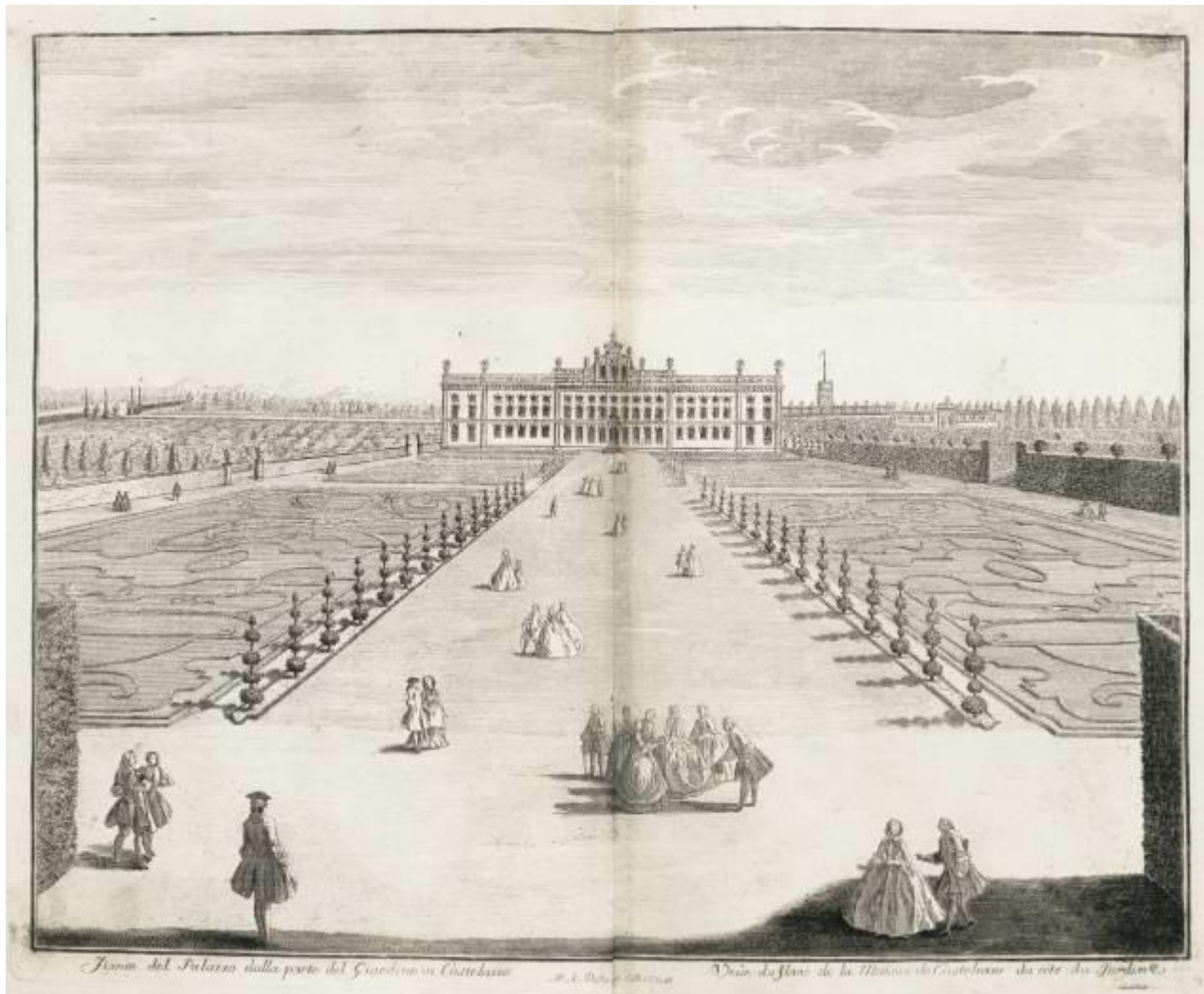
Marc'Antonio Dal Re – incisione che ritrae il parterre di Villa Arconati (1743)

Giuseppe Antonio Arconati la Versailles di Francia ebbe certamente modo di vederla, quando nel 1733 fu tra i delegati inviati dall’Austria alla corte francese per una importante missione diplomatica, dove però non fu ricevuto da Luigi XV.